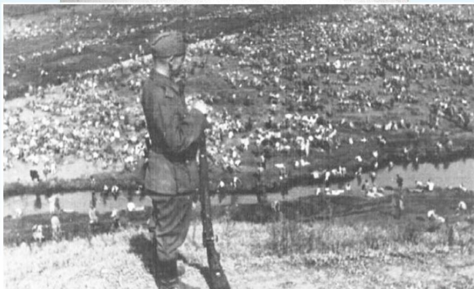
Дулаг – 125». 1942 г. Фото с немецкой фотоленки.